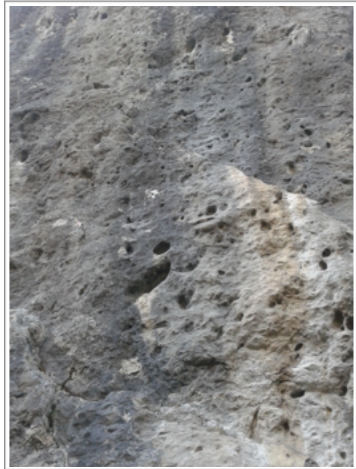
Le cri du caméléon 7b+